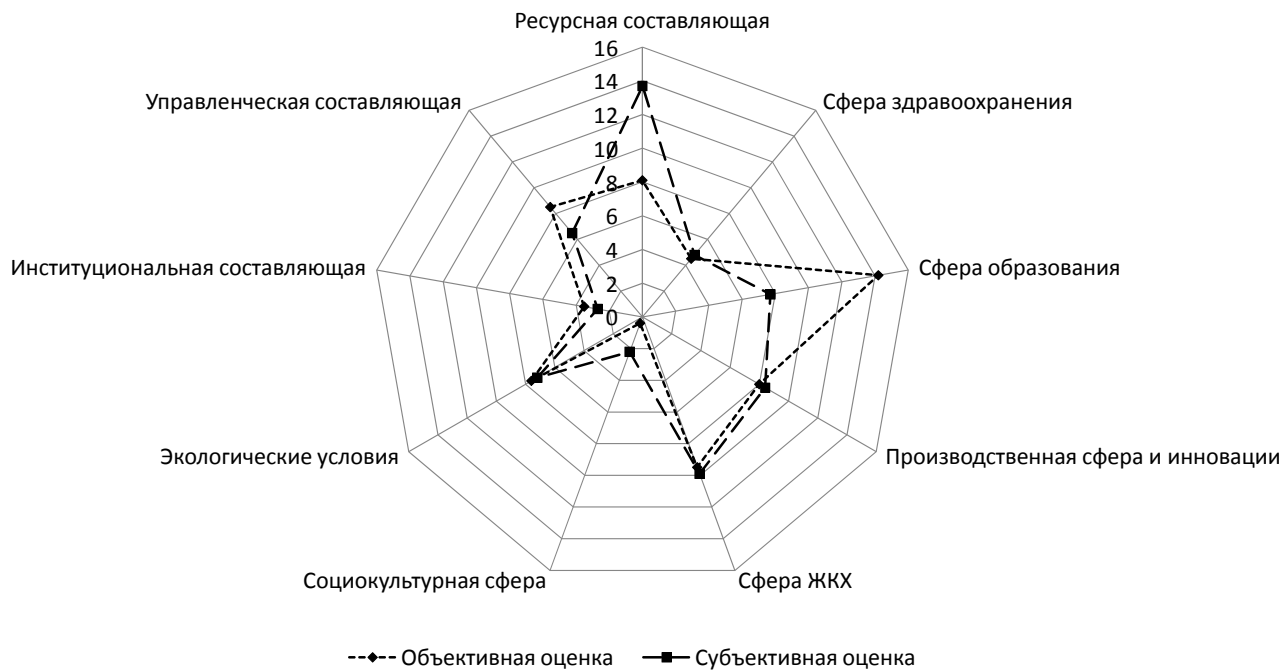
Рис. 3. Сопоставление объективных и субъективных оценок условий воспроизводства социально-трудового потенциала региона

вого потенциала региона совпадают и превышают среднее значение (соответственно 64,3 и 63,1). Это свидетельствует о достаточно стабильной ситуации в регионе и о наличии предпосылок к развитию социально-трудового потенциала в соответствии с новыми макроэкономическими императивами. Характеристики ростоформирующих и лимитиру-