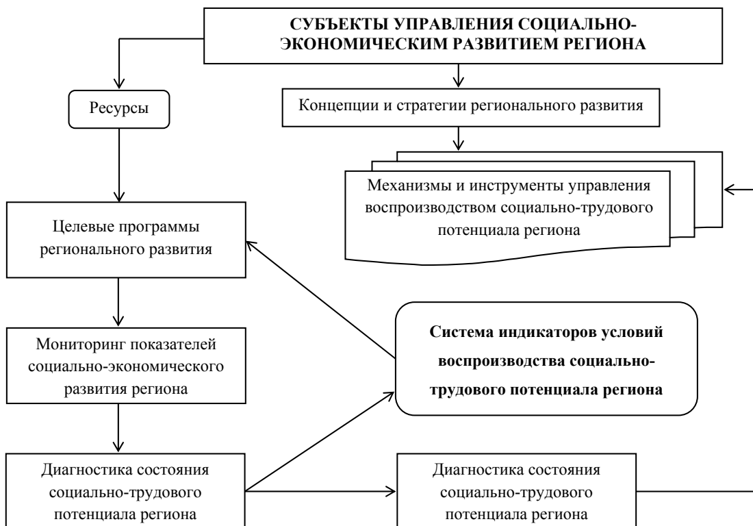
Рис. 1. Модель управления воспроизводством социально-трудового потенциала региона с позиций индикативно-целевого подхода

При этом диагностика условий воспроизводства социально-трудового потенциала территории является одним из важных этапов разработки региональных программ социально-экономического развития. С учетом необходимости адаптации к условиям макроэкономической нестабильности