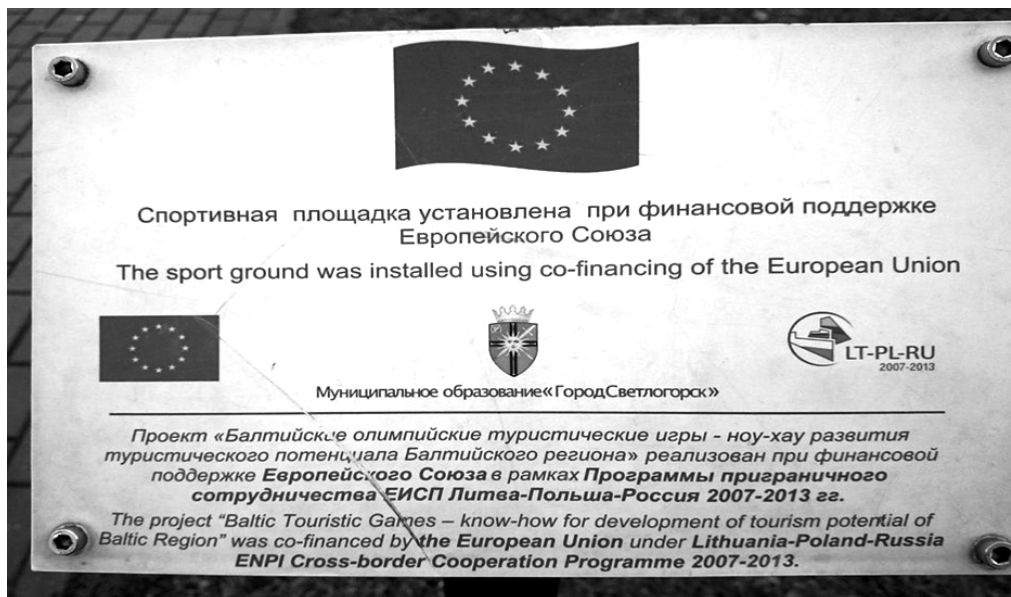
Figure 4 Sports ground construction supported by the European Union, Svetlogorsk