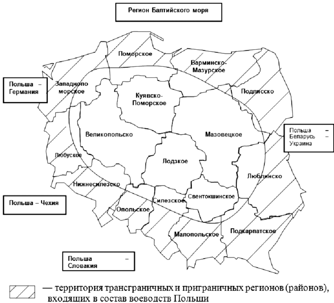
Figure 5 The Polish regions involved in cross-border cooperation