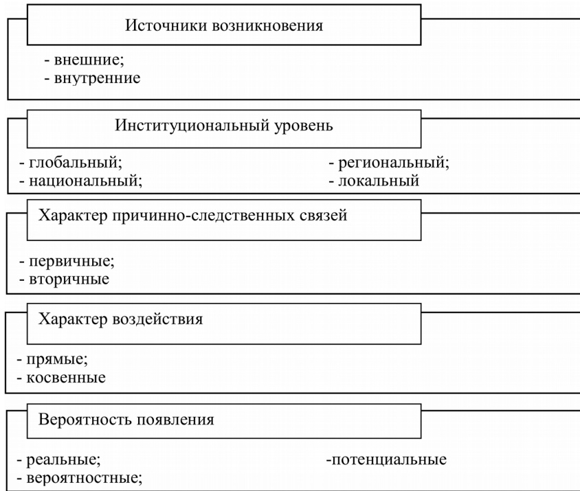
Figure 2 The classification of threats