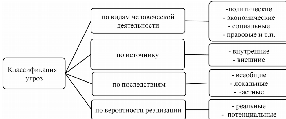
Figure 1 The classification of economic security threats

Источник: составлен по материалам: Гончаренко Л.П., Баланюк Л.Л., Филін С.А. и др. Экономическая безопасность: учебник для вузов / под общ. ред. Л.П. Гончаренко. М.: Юрайт, 2018. 340 с.