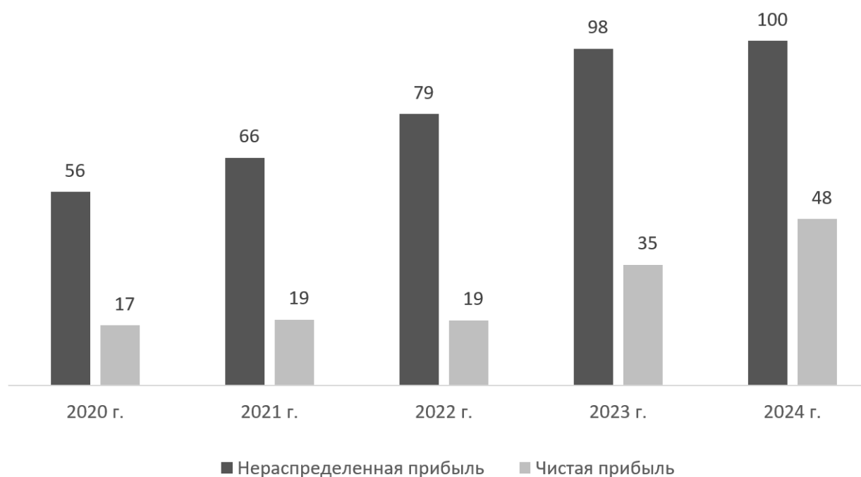
Figure 1 NCC profit by year, billion RUB