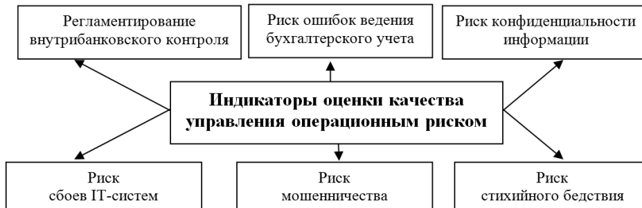
Figure 3 A group of key indicators for assessing the quality of operational risk management