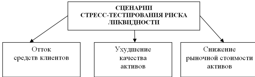
Figure 2 Typical scenarios in carrying out stress testing of liquidity risk