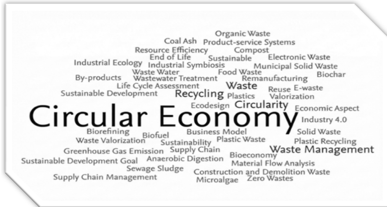
Figure 2 Circular economy: 50 key phrases

Примечание. Использован инструмент библиометрического анализа SciVal.