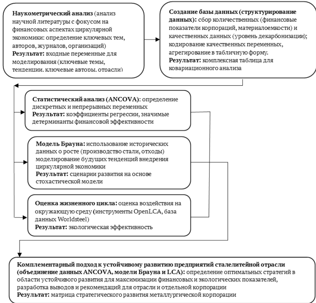
Рисунок 1 Интеграция методов и подходов к исследованию Figure 1 Integration of methods and approaches to research