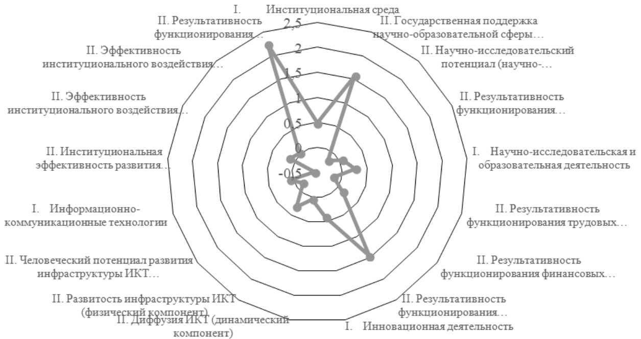
Structuring by Sub-Indices of First (I) and Second (II) Order of the Balanced Innovative Development Index of the Chuvash Republic, 2021