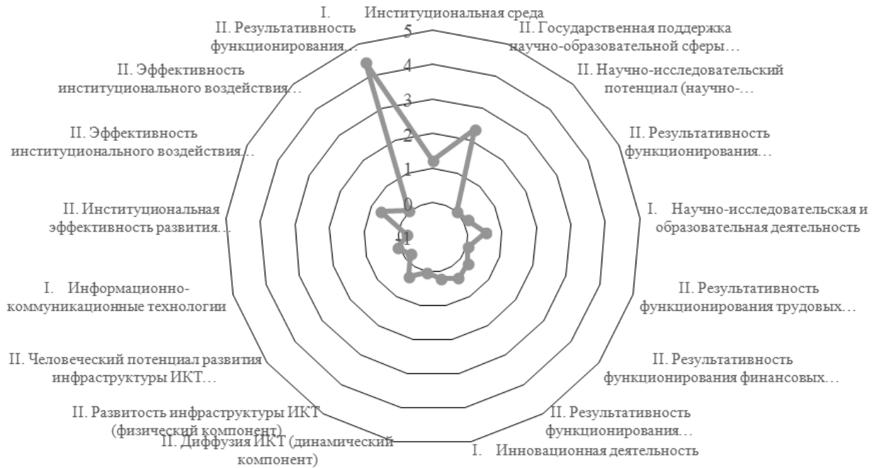
Structuring by Sub-Indices of First (I) and Second (II) Order of the Balanced Innovative Development Index of the Republic of Bashkortostan, 2021